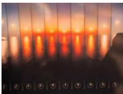
Prikaz sonca na gladini