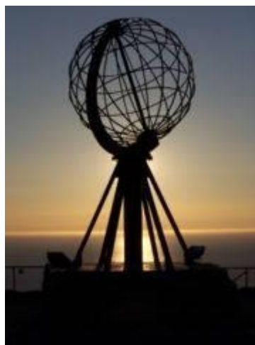
Globus na rtu

Še isto noč smo obiskali izjemen podzemni center Nordkapp s kino dvorano, kjer smo si ogledali tridimenzionalni panoramski film o Nordkappu in pokrajini Finmark, prikazan je bil v vseh štirih letnih časih. Po stopnicah smo se nato spustili še nižje pod površje Zemlje, kjer smo si ogledali muzej, moderno kapelo in rastlinsko-živalske razstave. Kot zanimivost smo izvedeli, da se lahko na Nordkappu tudi poročiš. Ura je bila kmalu 2.00 in center se je zaprl. Zunaj je deževalo in pripravljalo se je na neurje. Ljudje so hiteli vsak v svoje avtomobile in avtobuse. Tako kot mi. Polni vtisov smo se vračali čez tunnel in nazaj do naše počitniške hišice, kjer smo prevedrili noč.