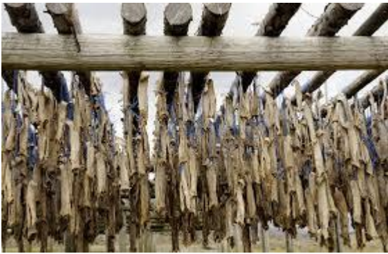
Bakalar - polenovka

Starejši gospod, naš najemodajalec, nam je povedal, da ima skoraj vsaka družina na Norveškem vikend, katerega oddaja v poletnem času. Tako smo, samo 5 kilometrov proč od turističnega vrveža, dobili hišico dosti ceneje. Zvečer nam je gospodar pokazal tradicionalne sušilnice polenovke, kjer sušijo ribe Bakalar, svojo glavno jed. Sušijo jih na visokih lesenih tramovih. Z nožem je odstrigel zgornji del glave in 4 polenovke odnesel v hišico, kjer nam jih je njegova žena pripravila za večerjo. Vsa družina nas je sprejela zelo toplo. Domača otroka sta brez zadržkov sprejela ponujene bombone iz Slovenije. V hvaležnih očeh sem jima brala »HVALA«. Gostoljubnost ljudi je tukaj neizmerna.