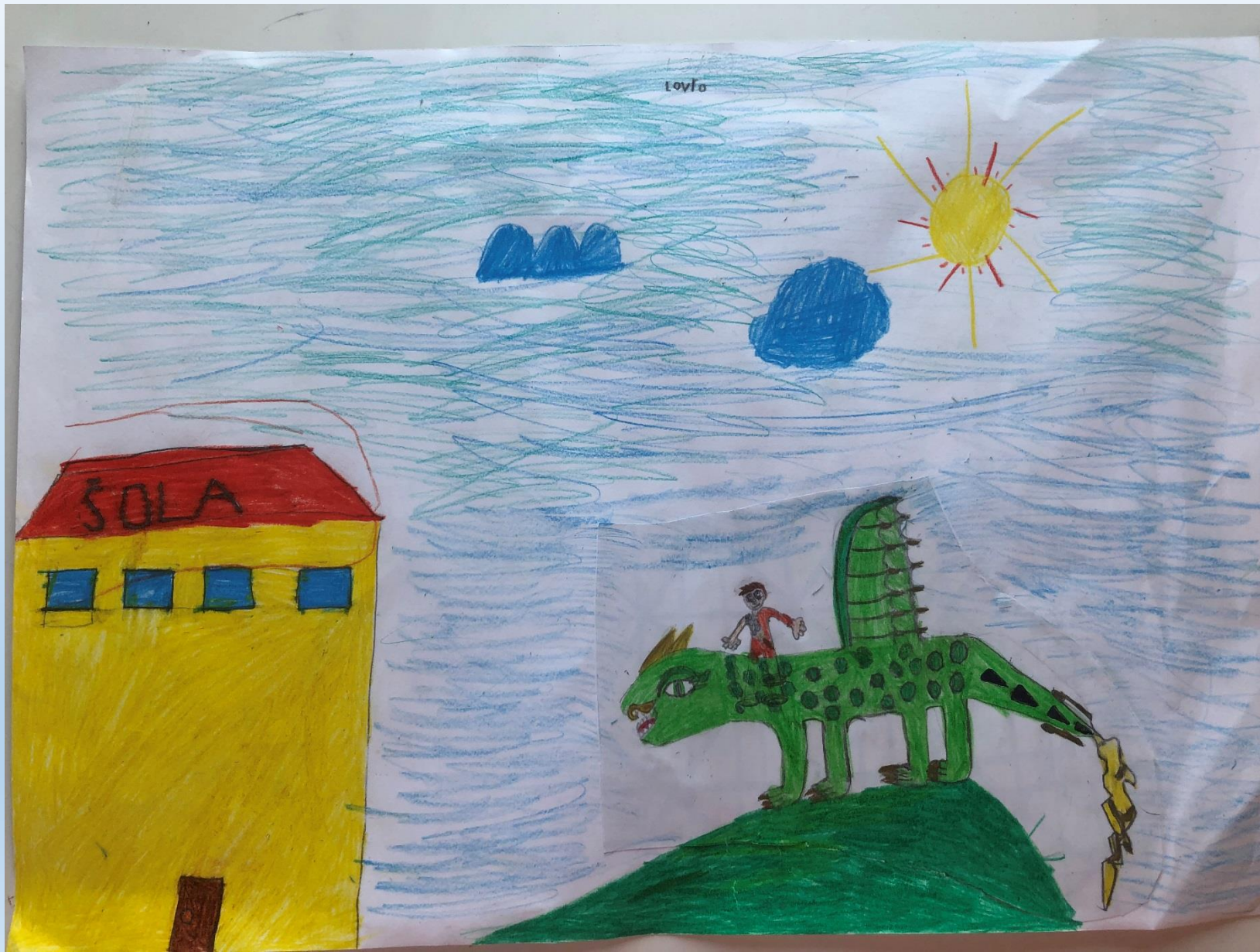
Lovro Pukl, 1. b

Kaj bi se zgodilo, če bi nam LEGO Ninjagoti posodili zmaje in bi z njimi potovali po zraku v šolo, ki je zunaj?